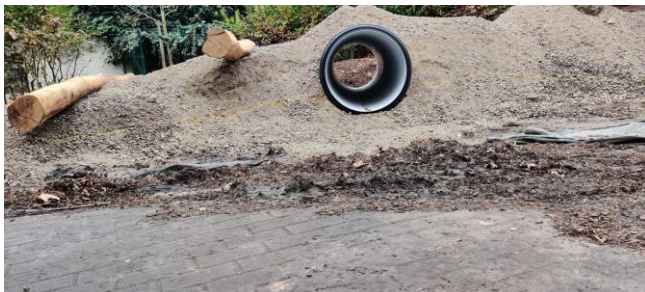
Speelheuvel in wording