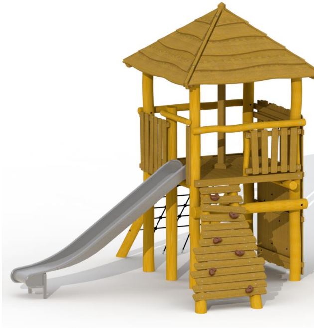
Voorbeeld van boomhut met speelelementen